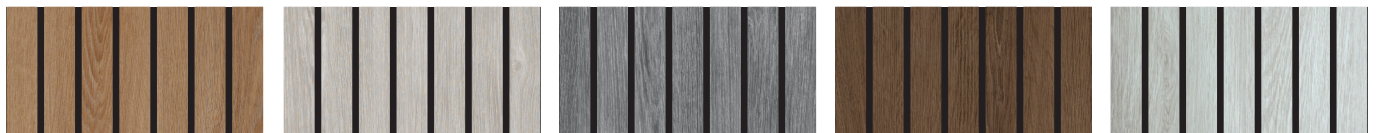
Turner oak malt TM_3001